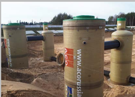
Индустриальный парк "Великий камень" "Оборудование для очистки поверхностного стока в составе ЛОС накопительного типа с самым большим в мире безбетонным аккумулирующим резервуаром АСО StormBrixx, Минск, Республика Беларусь